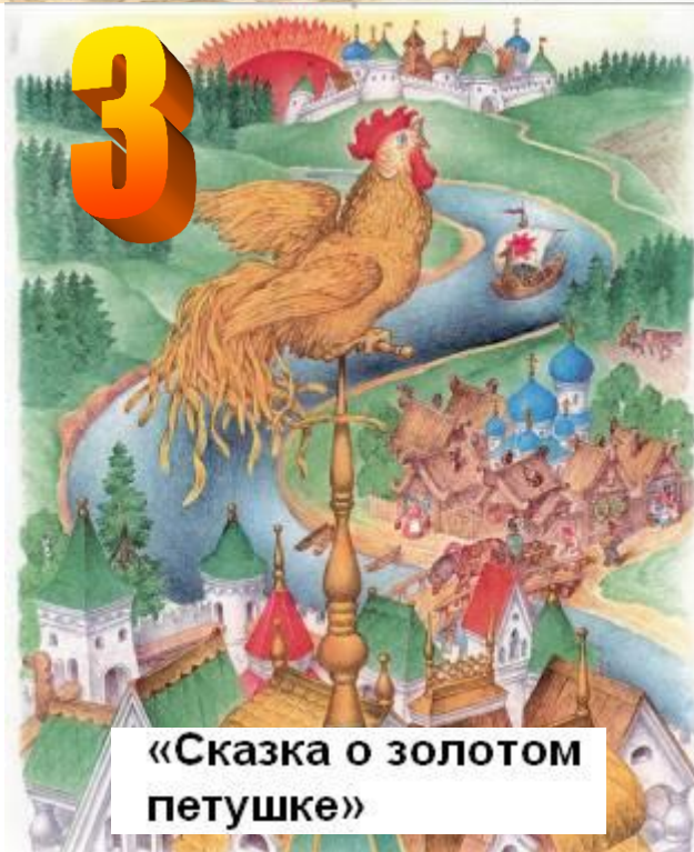
«Сказка о золотом петушке»