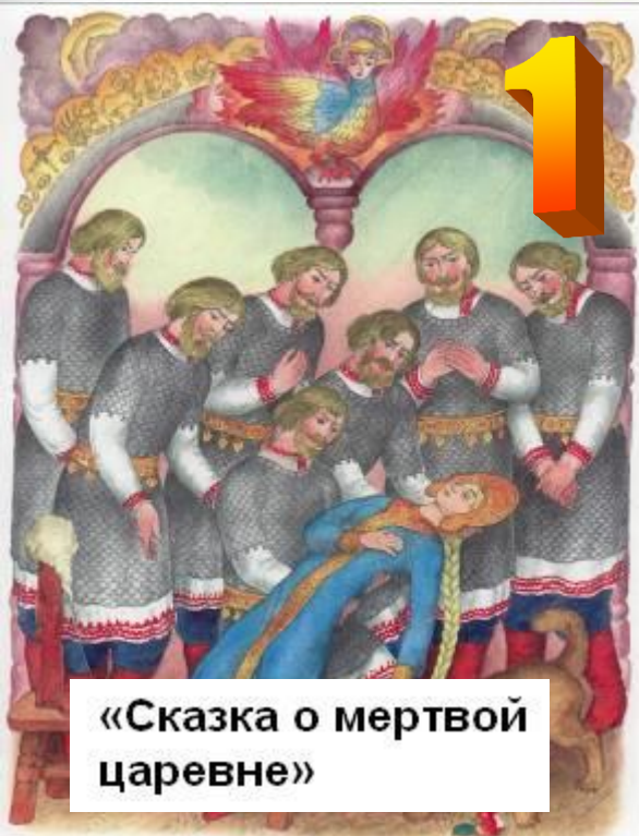
«Сказка о мертвой царевне»