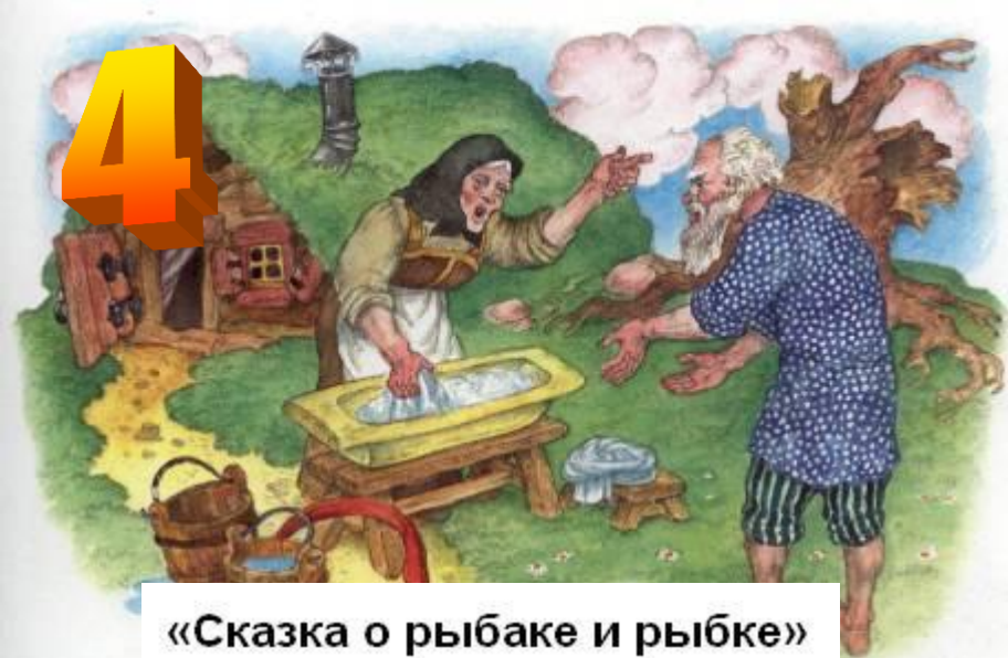
«Сказка о рыбаке и рыбке»