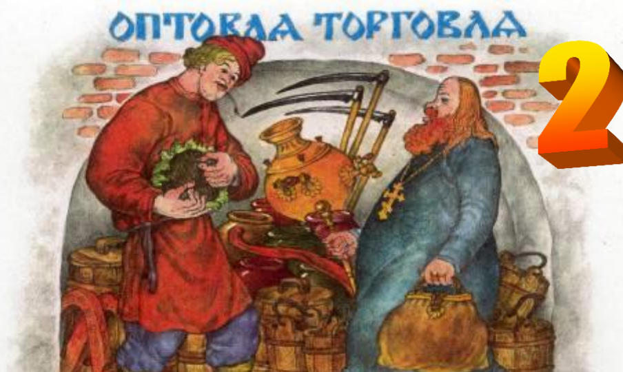
«Сказка о попе и о работнике его Балде»