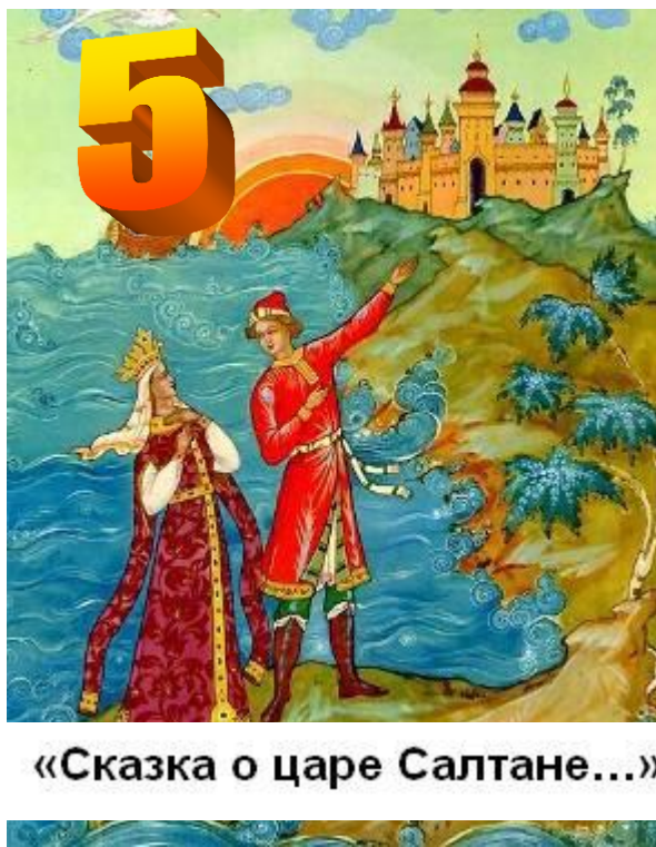
«Сказка о царе Салтане...»